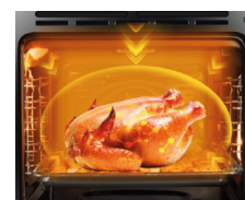
2-in-1: Ofen + Mikrowelle